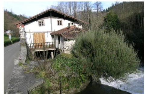
Molino de Errotabarri

Su actividad cesó en abril de 1975. El último molinero fue Andrés Aldekoa Ane .