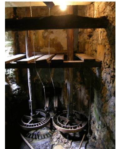
Zona de turbinas del molino de Ibareutxi