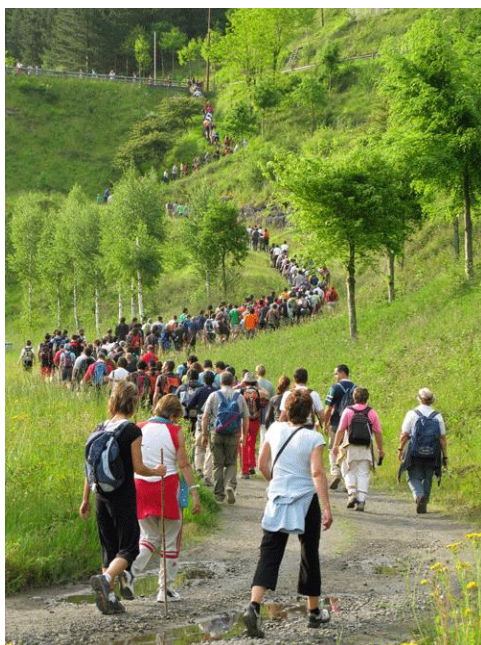
Participantes de la edición de 2018, dirigiéndose hacia la presa del embalse de Undurraga

Ibargutxi ; se trata de un molino rehabilitado por la familia Larrazabal, donde aquellos que lo deseen tienen la oportunidad de acceder a su interior para contemplarlo en funcionamiento. Desde Ibargutxi se camina hacia el molino de Lanbreabe, y desde aquí se vuelve hacia el embalse de Undurraga para bordearlo, en esta ocasión, por la margen opuesta; frente a la presa del embalse se sitúa el punto de avituallamiento, a cargo de Gastronomía Cantábrica . Tras reponer fuerzas, los caminantes se adentran primero en la barriada de Otzerinmendi y después en la de Uribe, donde pasan junto a los molinos de Intxaurbe, Axpe y Zulaibar, y ya en el último kilómetro del recorrido, se encuentran con el molino de Olabarri , que está totalmente rehabilitado y acondicionado para recibir visitas; se puede acceder al interior para contemplar las diferentes dependencias y verlo en funcionamiento, y, finalmente, enfilarse los últimos 300 metros que restan hasta la meta situada en la plaza de Zeanuri.