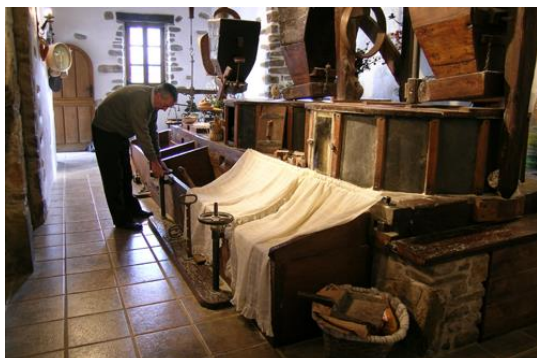
Interior del molino de Olabarri

3- Olabarri: Ubicado en la Cofradía de Ibagüen y asentado junto al río Arratia. Originariamente fue ferrería, y así aparece mencionado en la documentación del S. XVI. En la segunda mitad del siglo XIX fue transformado en molino.