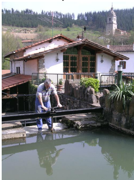
Trabajando en la antepara del molino de Olabarri

La salida se da a las 09:00 horas de la mañana en la plaza del pueblo, frente al Ayuntamiento. En el primer kilómetro los caminantes pasan junto a los molinos de Alcibar y Errotabarri . Este último fue rehabilitado el año 2015 por la familia Manterola y es el primero de los tres que se pueden visitar durante el recorrido. Seguidamente se bordea el embalse de Undurraga por el nuevo paseo— con pasarela de madera de unos 200 metros— que ha diseñado y abierto el Consorcio de Aguas Bilbao Bizkaia y que se inaugurará oficialmente. Una vez de dejar atrás el embalse, los participantes se encuentran con el molino Barrengoerrotta, ubicado al borde del arroyo Beretxikorta. De aquí se asciende hacia el caserío Agarre, para descender hacia la barriada de Undurraga y dirigirse al molino de