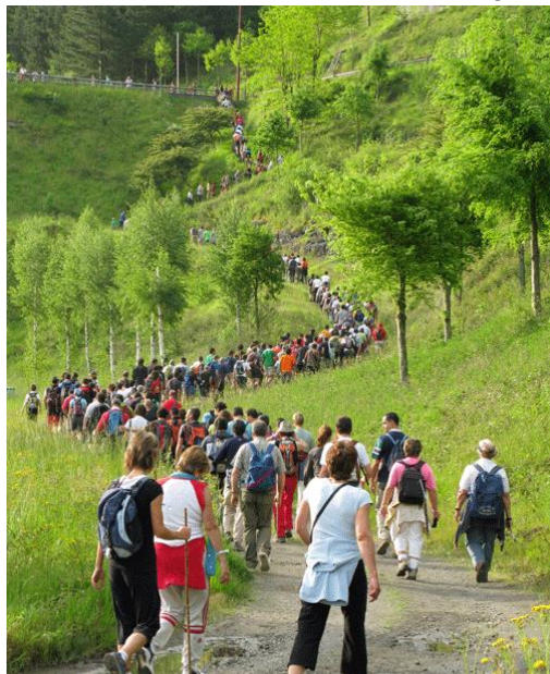
2017ko edizioko parte-hartzaileak Undurragako urtegiaren presara bidean

martxan ikusteko aukera izango da— erroten ondotik igaro ondoren, Undurragako urtegiaren ertzetik jarraituko dute parte-hartzaileek. Urtegia atzean utzi bezain laster, Barrengoerrota aurkituko dute Beretxikorta errekatxoaren ertzean. Agarre baserriaren ingurutik aurrera eginez, Undurraga auzunera jaitsiko dira Ibargutxiko errotarako bidea hartzeko; hemen ere, atek zabalik izango dira eta nahi dutenek kuku bat egin eta errota lanean ikusteko aukera izango dute. Ibargutxitik Lanbreabeko errotera, eta hemendik berriro Undurragako urtegiaren ertzetik ekingo diote —oraingoan beste aldetik—; urtegiaren presatik 100 metro aitzina, Alkiberren, indarrak berritzeko jan-edana banatuko du Gastronomía Cantábrica -k. Aurrerantzean, lehenengo Otzerinmendi auzunean eta gero Uriben sartuko dira ibiltariak, eta Intxaurbeko, Axpeko eta Zulaibargo erroten ondotik igaro ostean, azken kilometroa betetzen hasiko dira; helmuga baino 300 bat metro lehenago ibilbideko azken errota azalduko da, Olabarrikoa—aurten ezin izango da bertara sartu obratan baitago—, Zeanuriko plazara iritsi eta ibilaldiari amaiera eman aurretik.