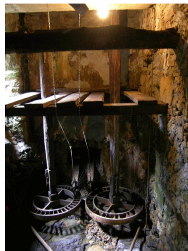
Ibagutxiko errotaren errotapea