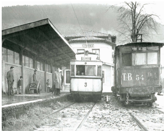
Lemoa fue el punto donde se bifurcaba la línea hacia Durango o hacia Zeanuri.

Las próximas paradas de la exposición serán Galdakao, Areatza, Basauri y Bilbao, donde finalizará su recorrido en la sala de exposiciones de la biblioteca de la Diputación Foral de Bizkaia.