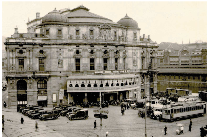
La plaza del Teatro Arriaga: punto de partida y llegada del Tranvía de Arratia