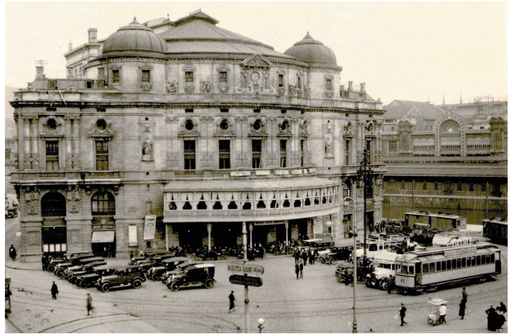
Arratiako tranbia Arriaga Antzokiaren plazako geltokian