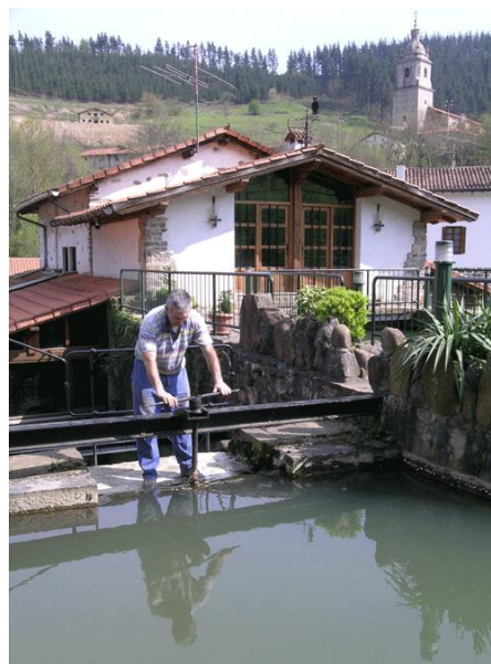
Trabajando en la antepara del molino de Olabarri

Tras reponer fuerzas, los caminantes se adentran primero en la barriada de Otzerinmendi y después en la de Uribe, donde pasan junto a los molinos de Intxaurbe, Axpe y Zulaibar, y ya en el último kilómetro del recorrido, se encuentran con el molino de Olabarri , que está totalmente rehabilitado; se puede acceder al interior para contemplar las diferentes dependencias y, finalmente, enfilear los últimos 300 metros que restan hasta la meta situada en la plaza de Zeanuri.