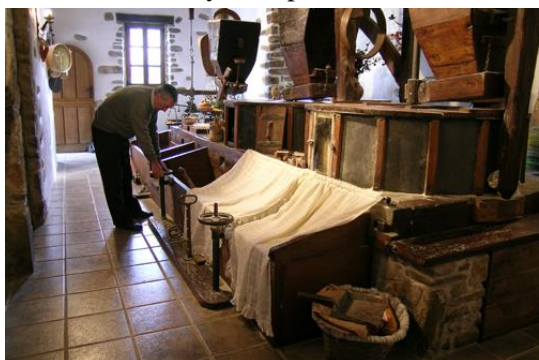
Interior del molino de Olabbarri

3- Olabbarri: Ubicado en la Cofradía de Iburgüen y asentado junto al río Arratia. Originariamente fue ferrería, y así aparece mencionado en la documentación del S. XVI. En la segunda mitad del siglo XIX fue transformado en molino.