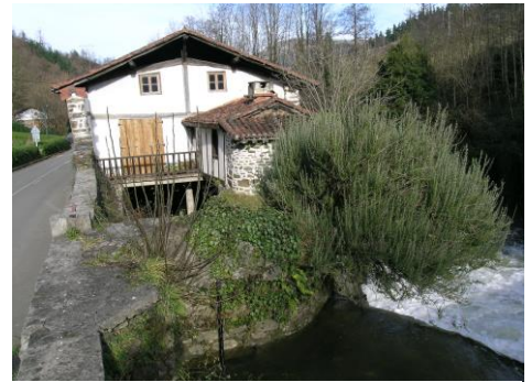
Molino de Errotabarri

En Errotabarri hay un calce que arranca en la estolda (desagüe) y se prolonga unos 80 metros en paralelo al río, hasta compensar el desnivel de la vía madre . Su actividad cesó en abril de 1975. El último molinero fue Andrés Aldekoa Ane.