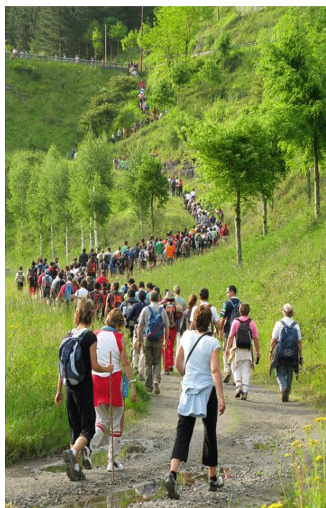
Participantes, dirigiéndose hacia la presa del embalse de Undurruga