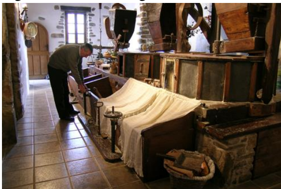
Urtean zehar bisita gidatuak antolatzen dira Olabarriko errotan