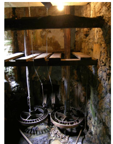
Ibartutxiko errotaren errotapea