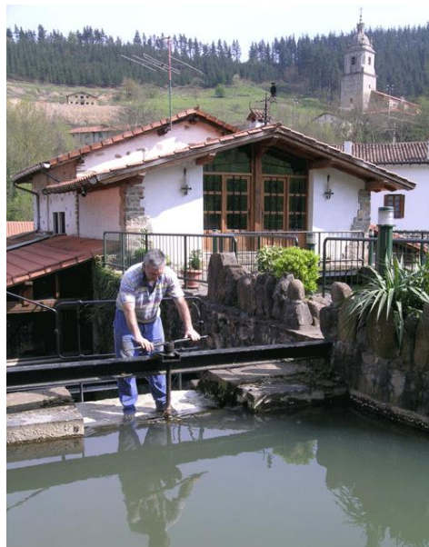
Olabarriko anteparan lanean

Ibilbidea 18 kilometrokoa da, baina haurrentzat edo ondo prestatuta ez daudenentzat laburragoa, 12 kilometrokoa, egiteko aukera ere eskaintzen da. Irteera herriko plazan izango da, goizeko 09:00etan; plazatik, udaletxearen aurretik, abiatuz eta Altziber eta Errotabarrin —hemen sartu-irtena egiteko eta errota martxan ikusteko aukera izango da— erroten ondotik igaro ondoren, Undurragako urtegiaren ertzetik aurrera egingo dute parte-hartzaileek, eta horretarako aurrez Bilbao Bizkaia Ur Partzuergoak diseinatu eta zabaldu duen bidea — 200 metroko egurrezko pasarela eta guzti— jarraituko dute; aldi berean, bide berri horren inaugurazioa ofiziala egingo da. Urtegia