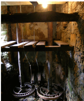
Ibargutxiko errotaren errotapea

1945ean errotaren azpiko aldean turbina eta generadore batez baliatuz argindarra ekoizten hasi ziren Ibargutxin, eta 1978ra arte gutxi gorabehera Altzua, Ipiñaburu eta Undurragako baserri batzuetara saltzen zuten elektrizitatea.