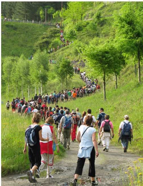
2014ko edizioko parte-hartzaileak Undurragako urtegiaren presara bidean

dira Ibargutxiko errotarako bidea hartzeko; hemen, atea zabalik izango dira eta nahi dutenek kuku bat egin eta errota lanean ikusteko aukera izango dute. Ibargutxitik Lanbreabeko errotera, eta hemendik berriro Undurragako urtegiaren ertzetik ekingo diote —oraingoan beste aldetik—; urtegiaren presatik 100 metro aitzina, Alkiberren, indarrak berritzeko jan-edana banatuko du Gastronomía Cantábrica -k. Aurrerantzean, lehenengo Otzerinmendi auzunean eta gero Uriben sartuko dira ibiltariak, eta Intxaurbeko, Axpeko eta Zulaibargo erroten ondotik igaro ostean, azken kilometroa betetzen hasiko dira; helmuga baino 300 bat metro lehenago ibilbideko azken errota azalduko da, Olabarrikoa —Pujana familiak erabat zaharberritua—, eta bisitatzeko aukera izango da, ate batetik sartuz eta bestetik atereaz, Zeanuriko plazara iritsi eta ibilaldiari amaiera eman aurretik.