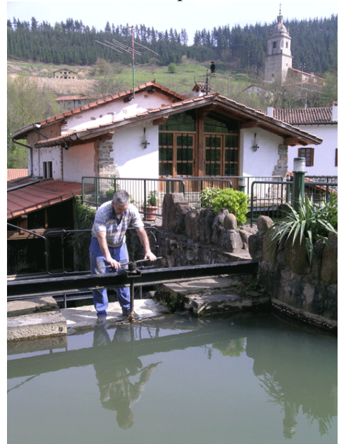
Olabarriko anteparan lanean

Aurtengo ibilbidea iazko berbera izango da, 18 kilometrokoa, baina haurrentzat edo ondo prestatuta ez daudenentzat laburragoa, 12 kilometrokoa, egiteko aukera ere eskaintzen da. Irteera herriko plazan izango da, goizeko 09:00etan; plazatik, udaletxearen aurretik, abiatuz eta Altziber eta Errotabarri erroten ondotik igaro ondoren, Undurragako urtegiaren ertzetik jarraituko dute parte-hartzaileek. Urtegia atzean utzi bezain laster, Barrengoerrota aurkituko dute Beretxikorta errekatxoaren ertzean. Agarre baserriaren ingurutik aurrera eginez, Undurraga auzunera jaitsiko