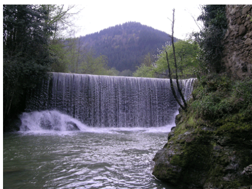
Errotabarriko errotaren presa