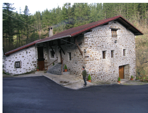
Ibargutxiko errotaren kanpoaldea