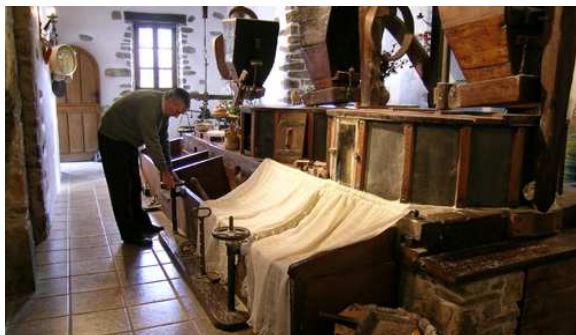
Bisita gidatuak antolatzen dira Olabarriko errotan